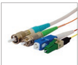
可用于 Lynx-Custom Fit™ 热缩快接