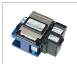
光纤切割刀 FC-6 / FC-6R 系列