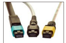
Lynx-Custom Fit™ 热熔快接