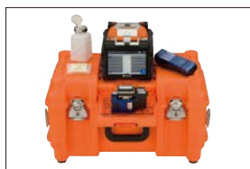
带工作台的收容箱 CC-82