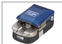
手持型光纤切割刀 FC-8R系列